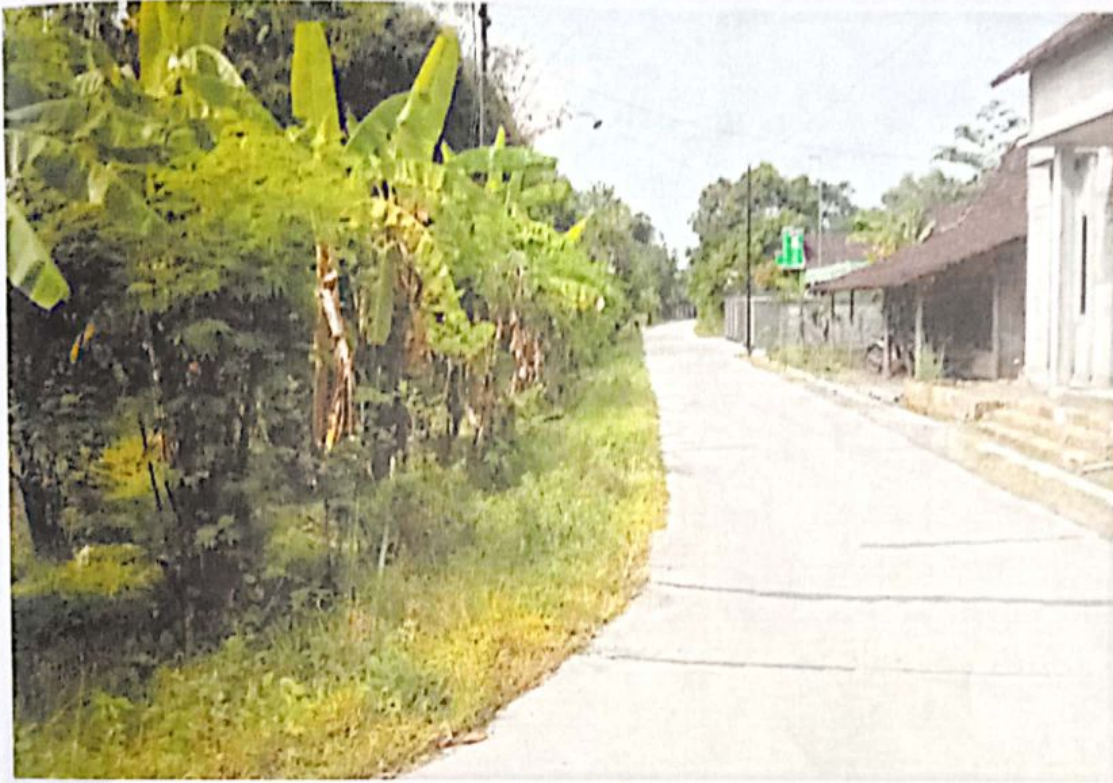
FOTO LOKASI PEMBANGUNAN REHABILITASI TALUD JALAN RT 5 RW 1 TANGGEL DESA TANGGEL 0%