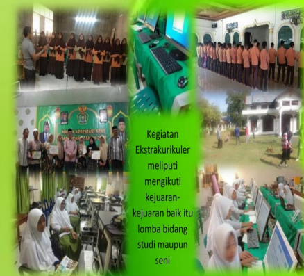
Kegiatan Ekstrakurikuler meliputi mengikuti kejuaran-kejuaran baik itu lomba bidang studi maupun seni